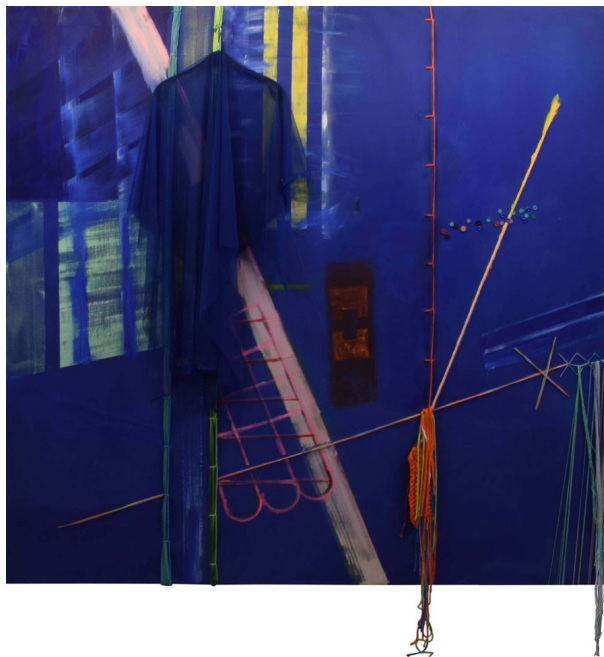
Sophia, 2021, 2 x 2 m, acrylverf, textiel, wol, knopen op canvas

Hoe zeer zij ook –figuurlijk– verweven is met de werken blijkt bijvoorbeeld uit de titels van de doeken: de vrouwen- en mannennamen maken van de doeken personages. Het is aan de toeschouwer om de desbetreffende karakters achter de portretten te ontleden.